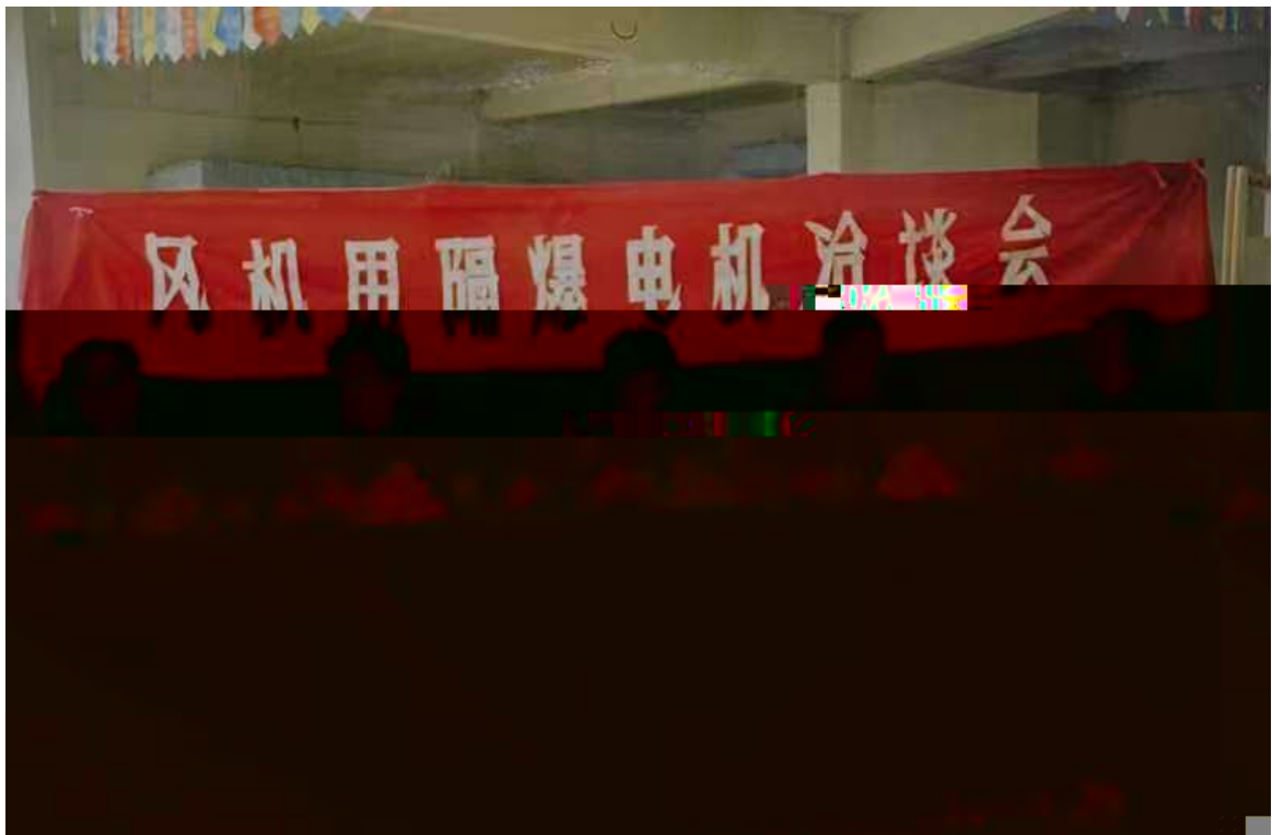
卧龙集团“风机用隔爆电机洽谈会”