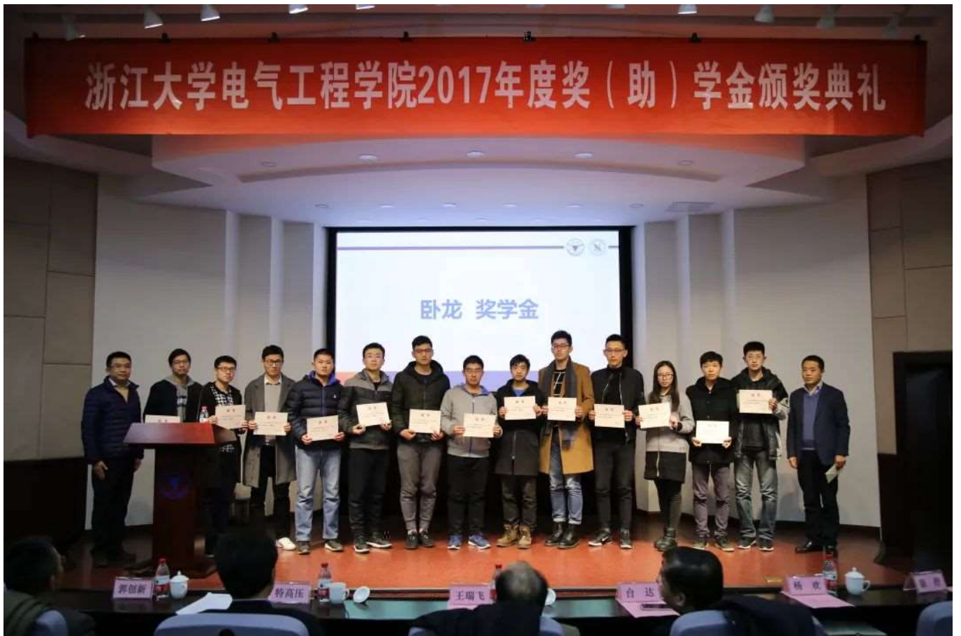
2017年度卧龙奖学金颁奖仪式